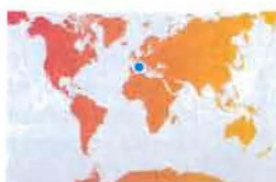
d'un écosystème, ou

écosystème dans lequel le virus va circuler. » Celui-ci pourrait muter, se recombiner avec d'autres souches déjà présentes, ou encore, infecter d'autres