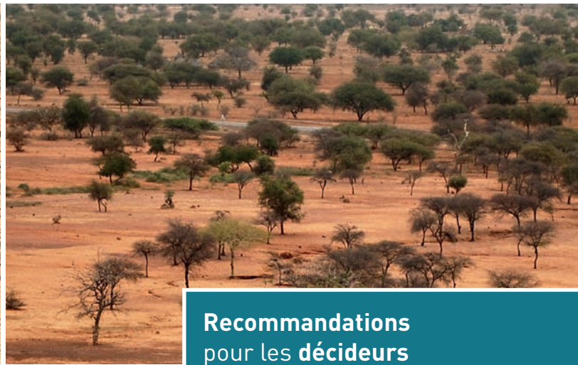
Paysage sahélien.

Dans le cas de la grande muraille verte de Chine, plutôt qu'un barrage, il s'agit d'un gigantesque projet d'aménagement intégré pour lutter contre la désertification sur un territoire de plus de 4 000 km de long sur 1 000 km de large, combinant plantations forestières et arbustives, plantes herbacées de couverture dans le cadre de systèmes de production.